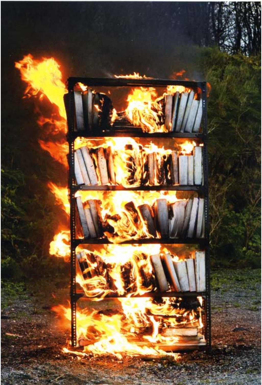
"Reolen i landskabet" af Bruno Kjær og Niels Fabæk. En kommentar til kunstens rolle.